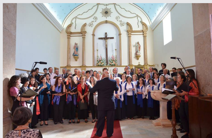
Encontro de Coros

Com o intuito de preservar raízes e costumes, o Alburitel Cultural pretende simultaneamente fomentar o interesse pela cultura por parte das gentes da freguesia.