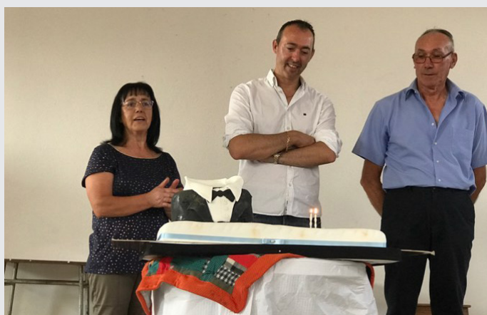
Contador de estórias

O cartaz deste ano distinguiu-se pela multiplicidade de actividades disponíveis, nomeadamente, um rally paper noturno, passeios pedestres pela região, festival de sopas, uma noite dedicada ao teatro na Acureto, para além do Encontro de Coros na Igreja da freguesia e do já carismático Festival Sons da Serra.