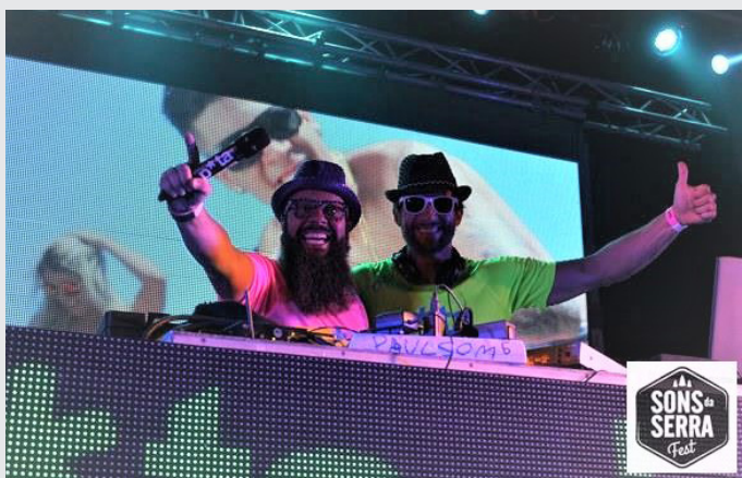
Sons da Serra