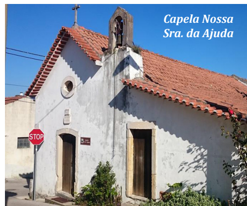
Capela Nossa Sra. da Ajuda

A nossa empresa dispõe ainda de maquinaria para movimentação de terras, escavações, pelo que consegui-