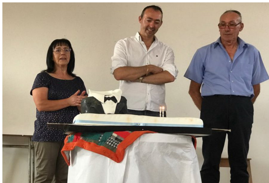
Com a família, na festa do seu aniversário

ção de Toucinhos. Os participantes (amigos, familiares e funcionários) reuniram-se num convívio/banquete oferecido pelo aniversariante que rumou a França no dia 28 de Agosto, levando certamente na memória a recordação dos belos momentos passados nesta terra que lhe é tão querida.