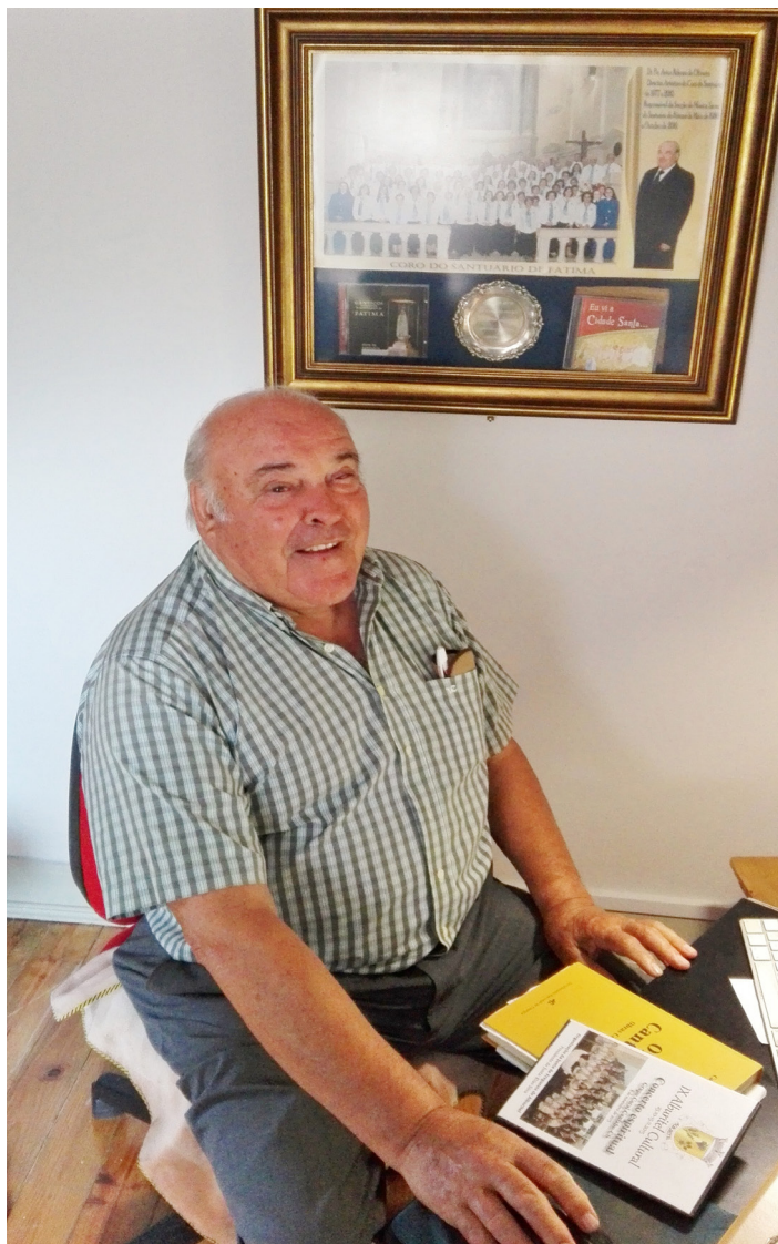
O pároco continua cheio de projectos e novas ideias

Em 1983, o bispo convidou-o para ser director do colégio São Miguel em Fátima, o que na prática nunca aconteceu. "Fui estudar para Paris durante 2 anos, no Instituto Superior de Pedagogia e tornei-me depois director de um colégio na Marinha Grande, na altura Externato Afonso Lopes Vieira, onde estive durante 6 anos e daí é que vim a tempo inteiro para o Santuário", relata o pároco.