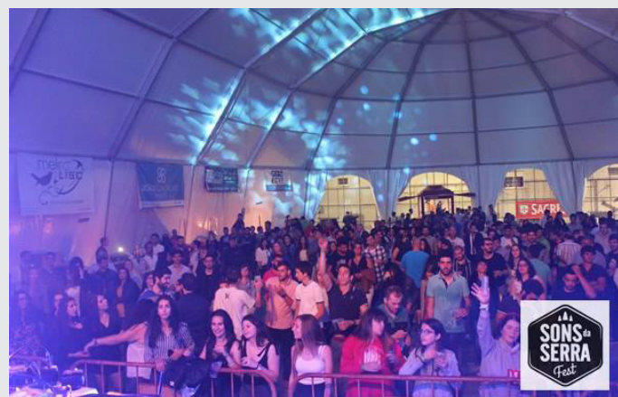
Sons da Serra