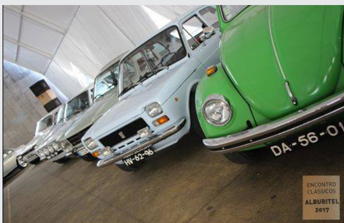
Encontro de clássicos